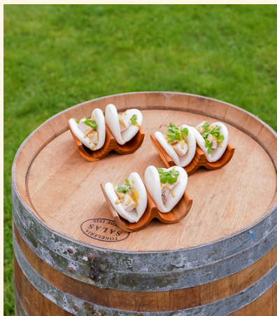
bao au poulet Sauce cacahouète, coriandre fraîche