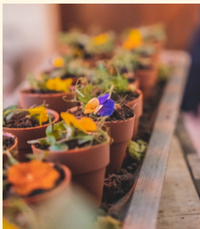
mini pot de fleur , crumble effet terre, fleurs, crème au gorgonzola