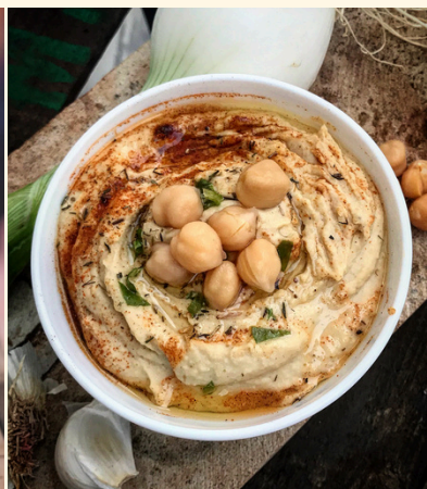
houmous onctueux citron, coriandre, menthe, huile d'olive d'Estoublon à l'ail