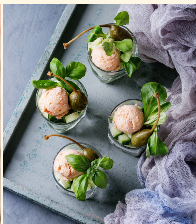
verrine au fromage frais , sirop d'érable, menthe, bacon et concombre pickles