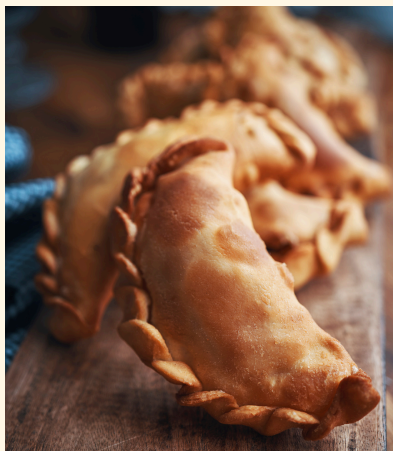
empanadas maison , au veau, coriandre, et citron fermenté