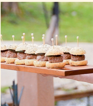
burger de veau Sauce barbecue cassis, concombre en pickles