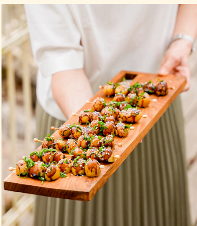
yakitori végétal Rattes braisées, laquage yakitori, cébette, sésame