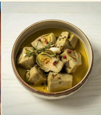
artichaut mariné au citron menthe fraîche, citron, crème à la fourme d'ambert