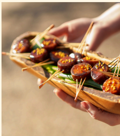
maki au boeuf fumé , orge perlé, laquage à la sauce soja premium